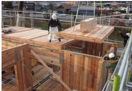
CLT 勝山共同住宅 建方 (2014年12月)

全国的にも公共建築物等への木材利用の気運が高まりつつある中、建築・設計関係者、木材関係者及び行政関係者等を対象に、CLTの特性を活かした建築物への使用方法や利活用促進に関する内容で講演会を開催します。当セミナーを通して、CLTを活用した建築物が普及展開することにより、木材の利用促進及び需要拡大に繋がり、地域の林業・木材産業の振興や雇用の創出による地方創生が図られることを目的としています。