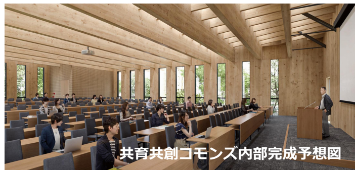
共育共創コモンズ内部完成予想図