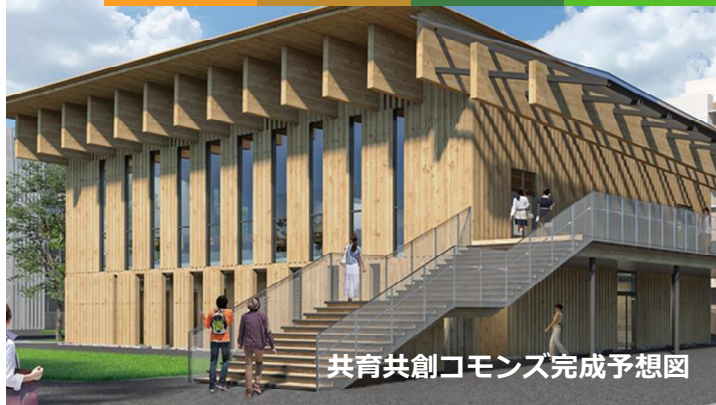
共育共創コモンズ完成予想図